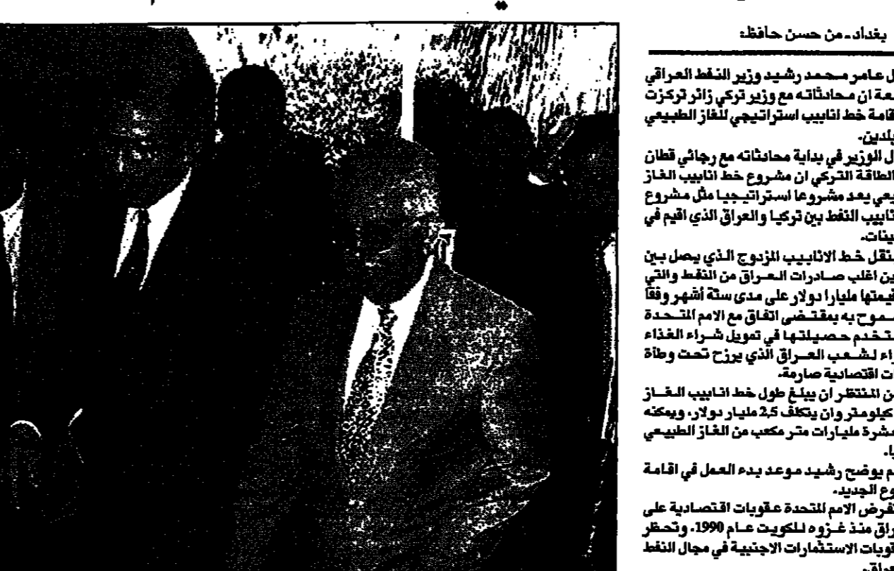
بغداد- من حسن حافظ